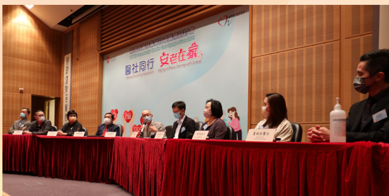
「社區醫療服務研討會」得到社區醫療夥伴支持，台上台下皆星光熠熠。

新界西聯網早前再次舉辦「社區醫療服務研討會」。今年的主題是「醫社同行：安老在家」，從多角度探討如何透過醫社合作的模式，推動居家安老，提升長者護理服務的質素，促進長者的身心健康，樂享頤年。