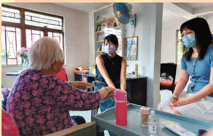
聖公會聖匠堂長者地區中心「安寧在家」居家照顧支援服務。

研討會反映非常熱烈，於現場及線上的參加人數共超過 400 人。社區醫療服務研討會籌委會主席劉智祥醫生表示，有賴一群一直緊密合作的社區夥伴，攜手推廣醫社合作的社區醫療模式，讓我們的長者病人離院後繼續過著快樂且有質素的「安老在家」生活。