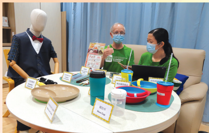
嶺大賽馬會樂齡科技與智能安老計劃。