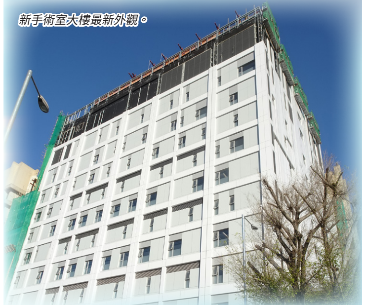
新手術室大樓最新外觀。

新大樓地下日後為急症室新翼，故此經過詳細研究及勘探後，屯門醫院選定了在三個位置與現有急症室打通相接。鑑於其中一個位置位處急症室治療區域內，為減少服務帶來的影響，並保障病人私隱，我們已要求承建商施工時要把相關位置及附近圍封，避免妨礙診症。在竣工後，有關位置已經安裝了木門及上鎖，以策安全。